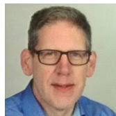
Harm Super Secretaris